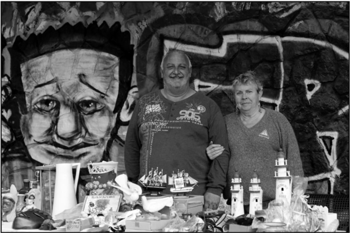
Sète 33