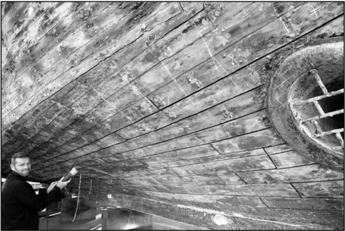
Sète 5