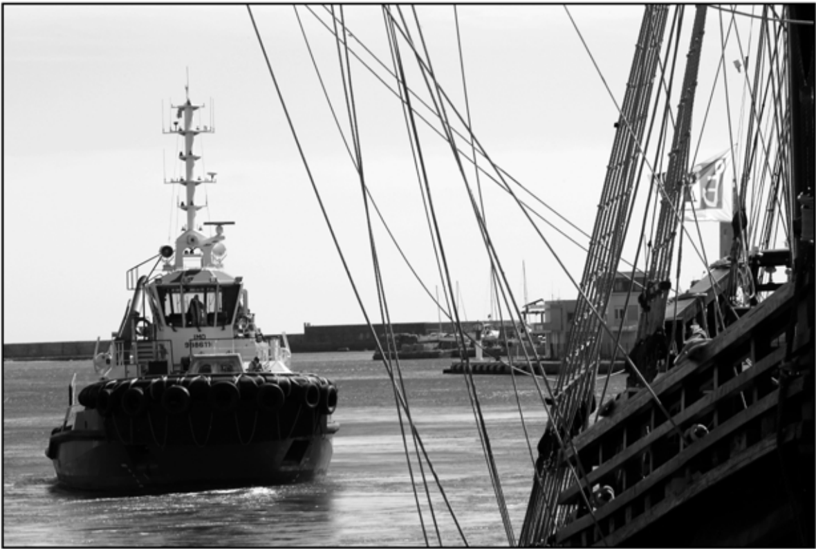
Sète 41