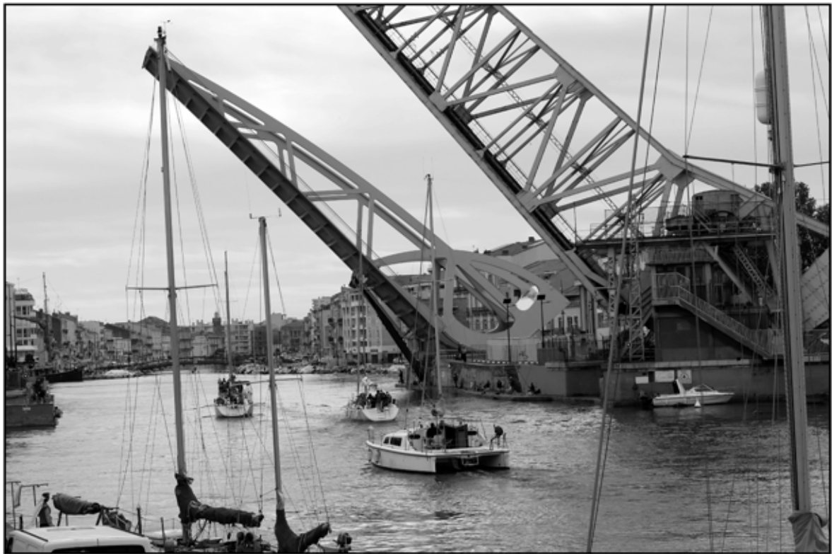
Sète 48