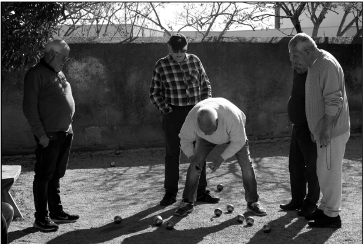
Sète 24