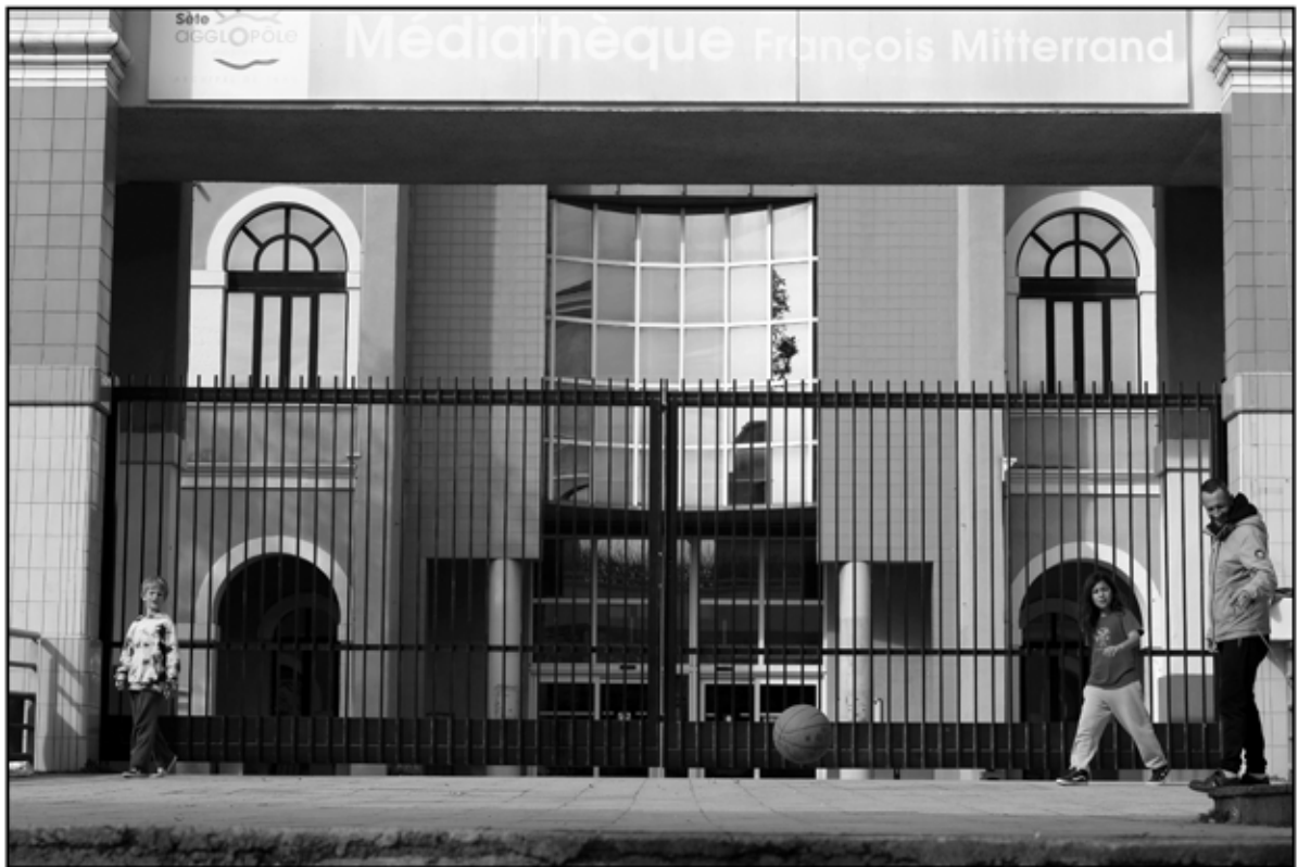
Sète 35