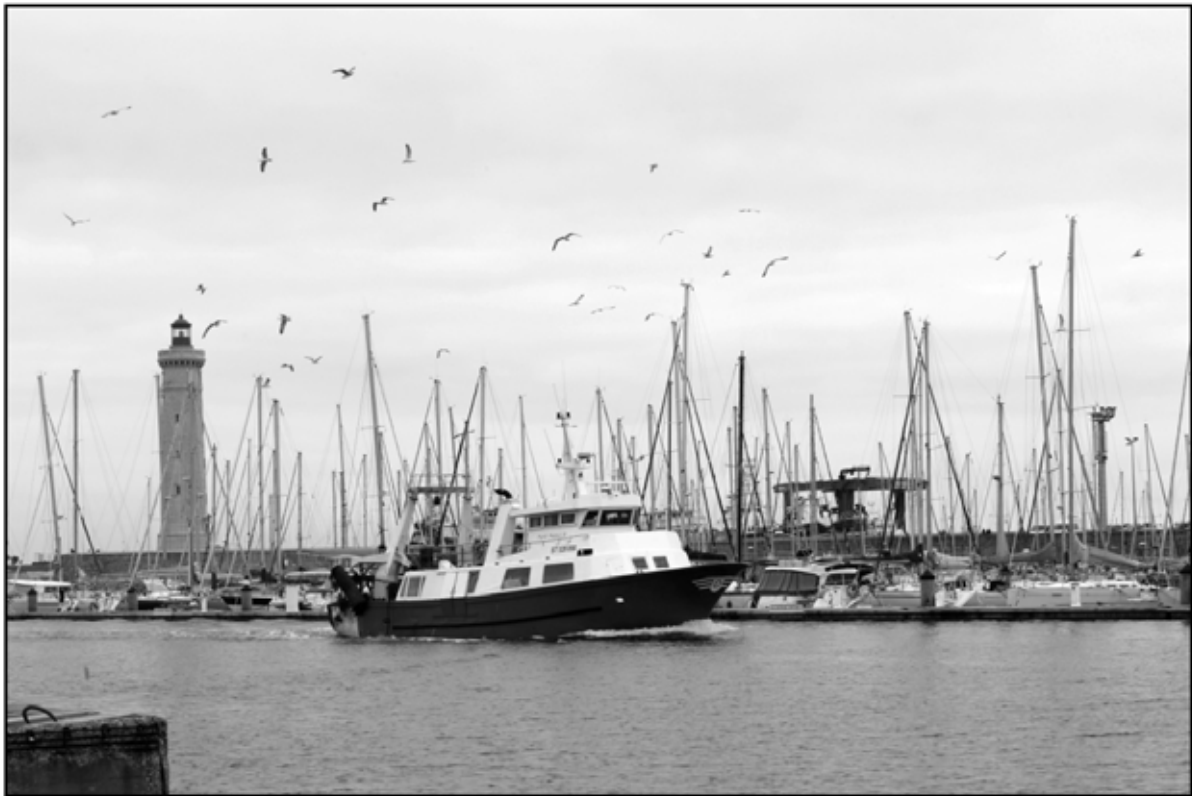
Sète 3