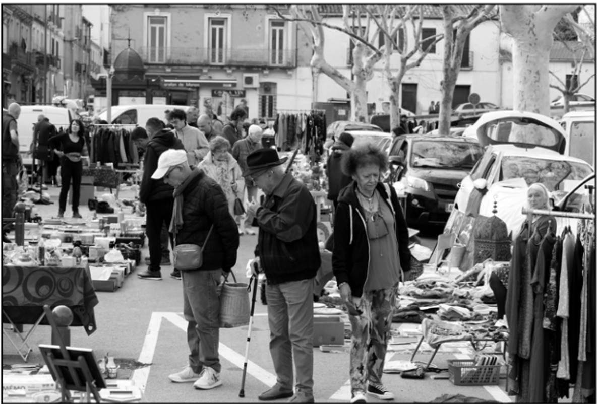
Sète 34