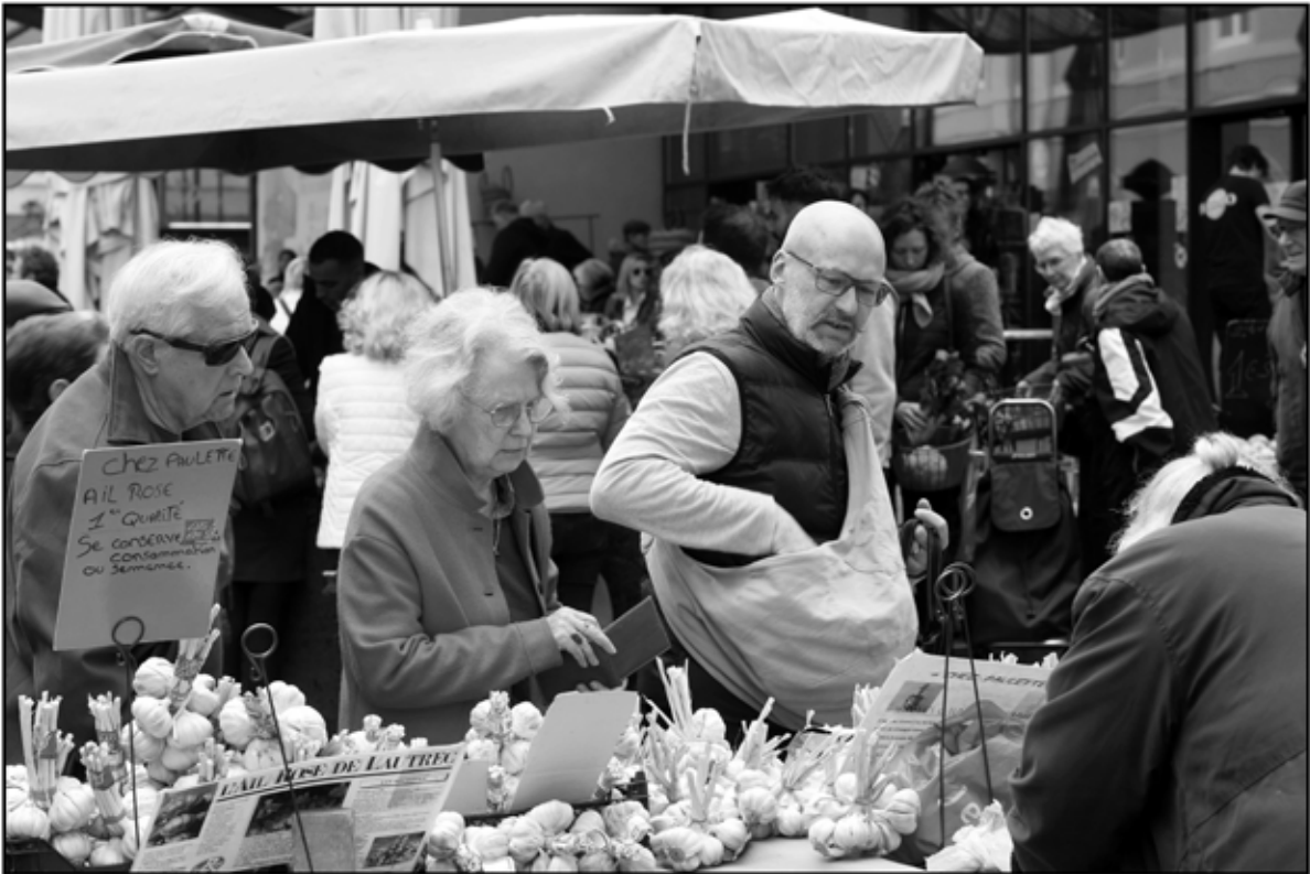
Sète 12