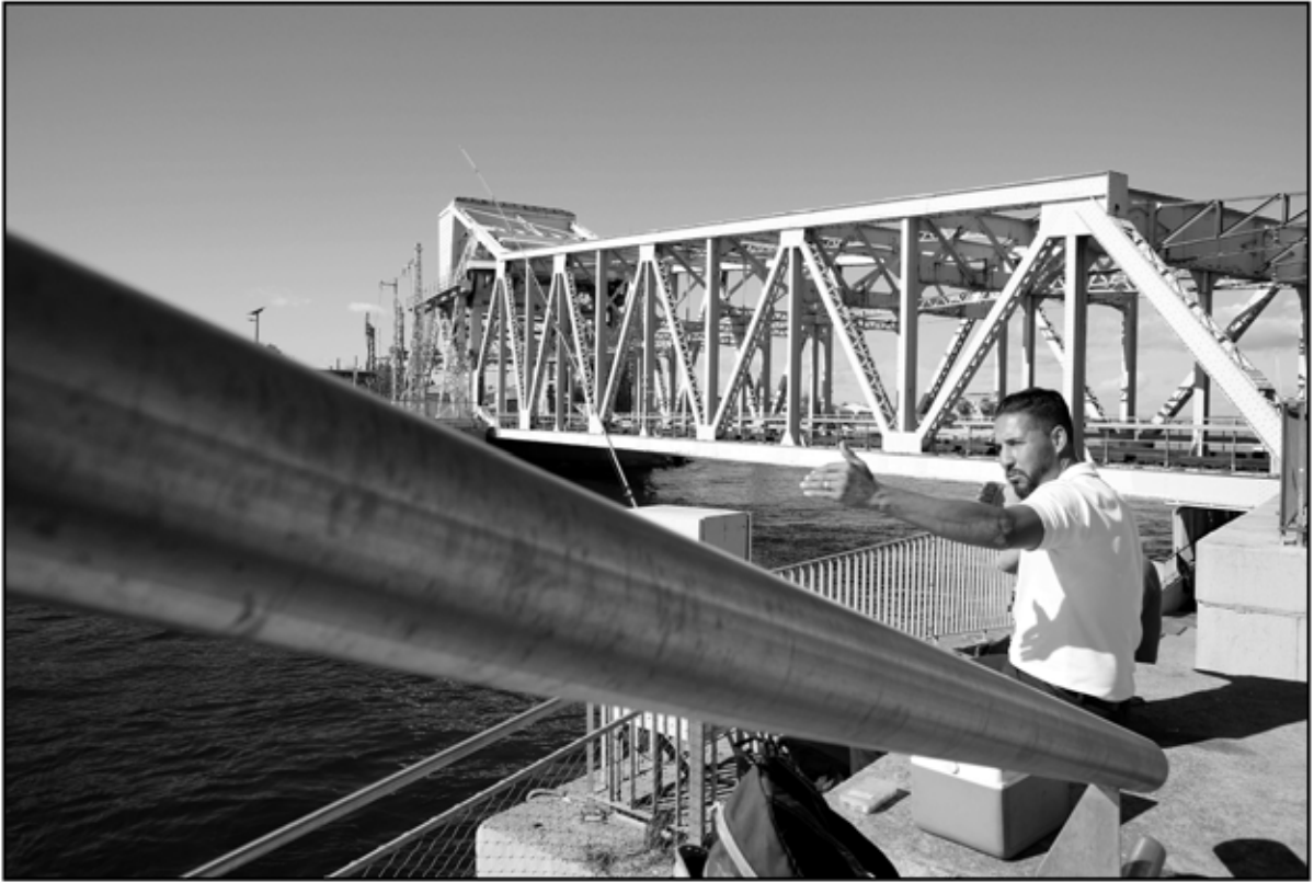
Sète 19 © Serge Assier