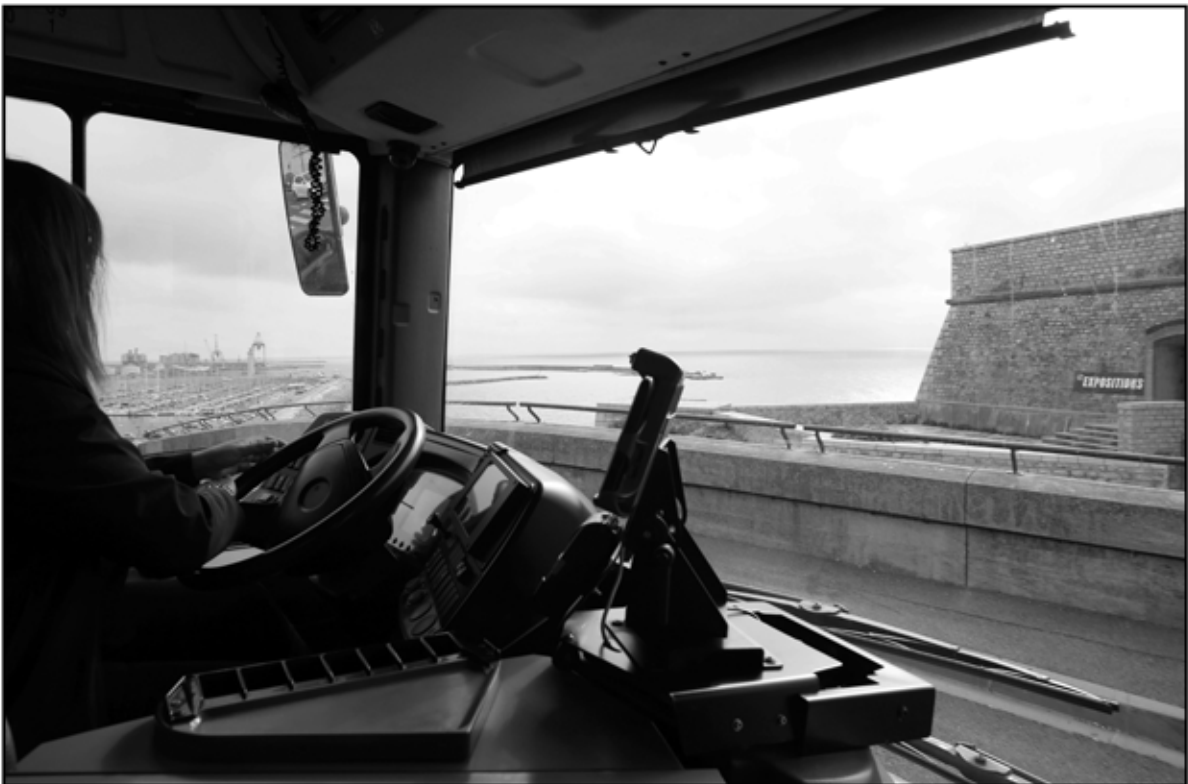
Sète 16