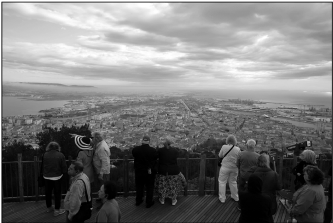
Sète 50