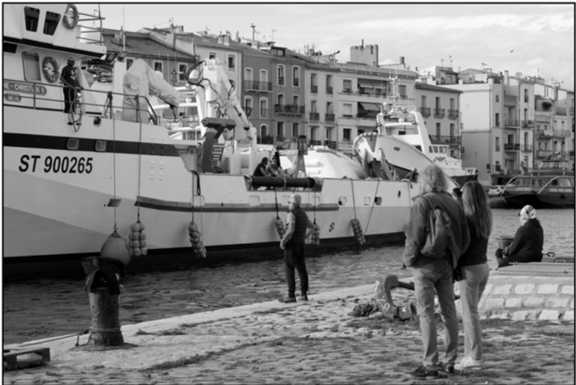
Sète 6