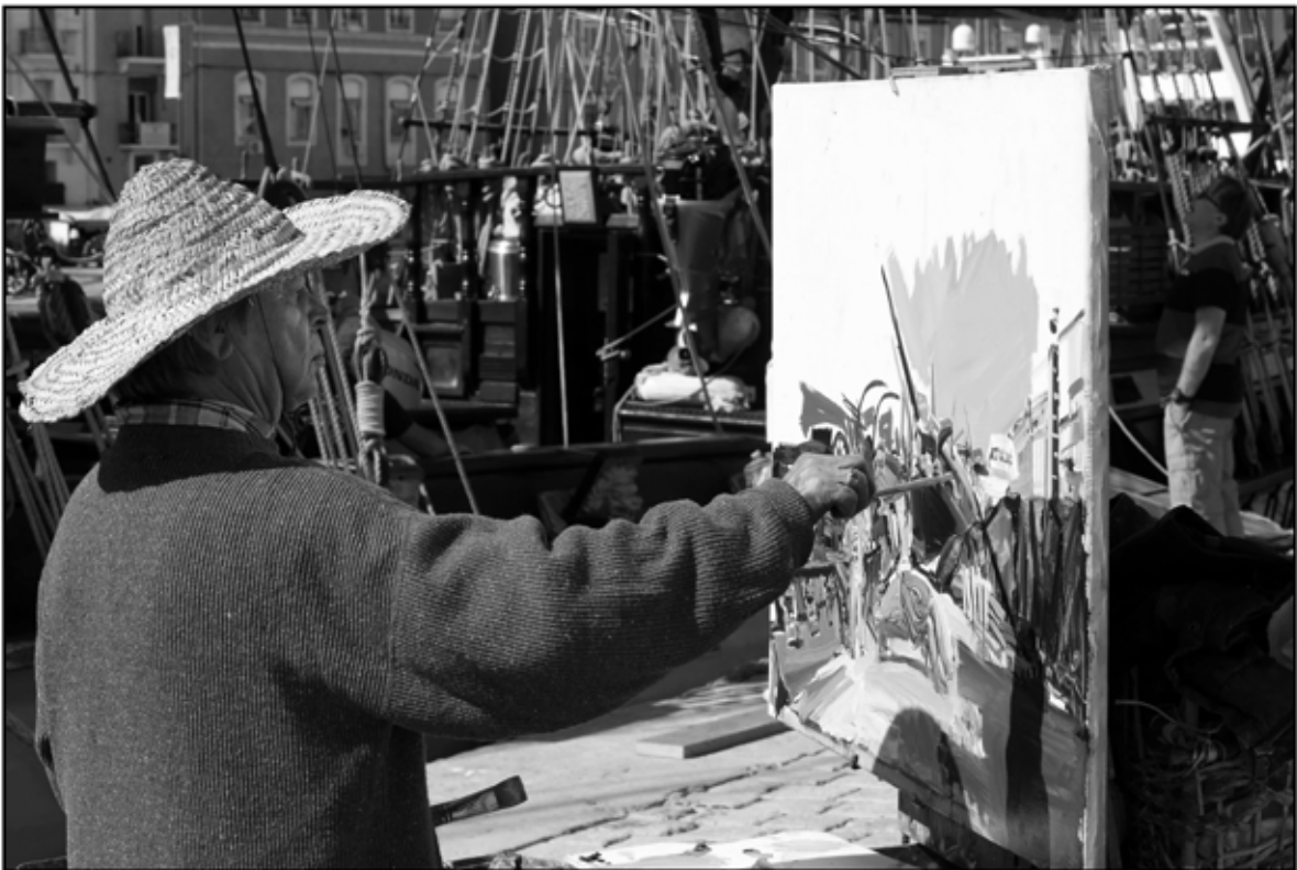
Sète 42