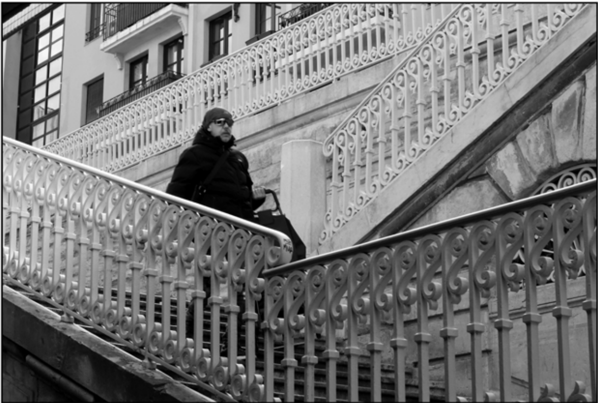
Sète 15