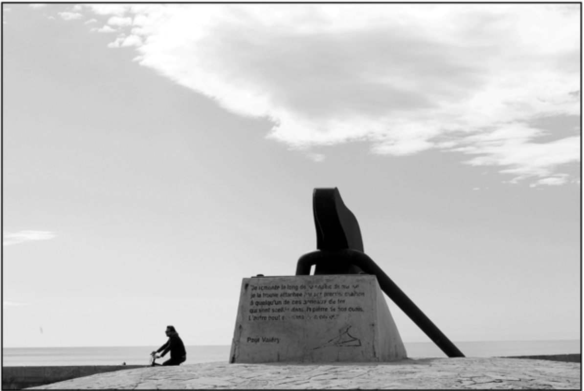
Sète 1