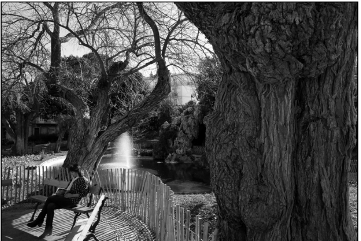
Sète 38