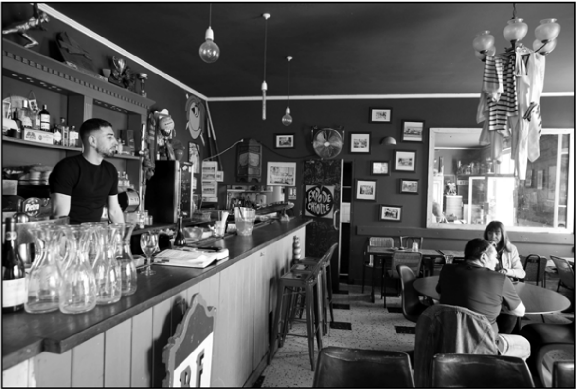
Sète 31