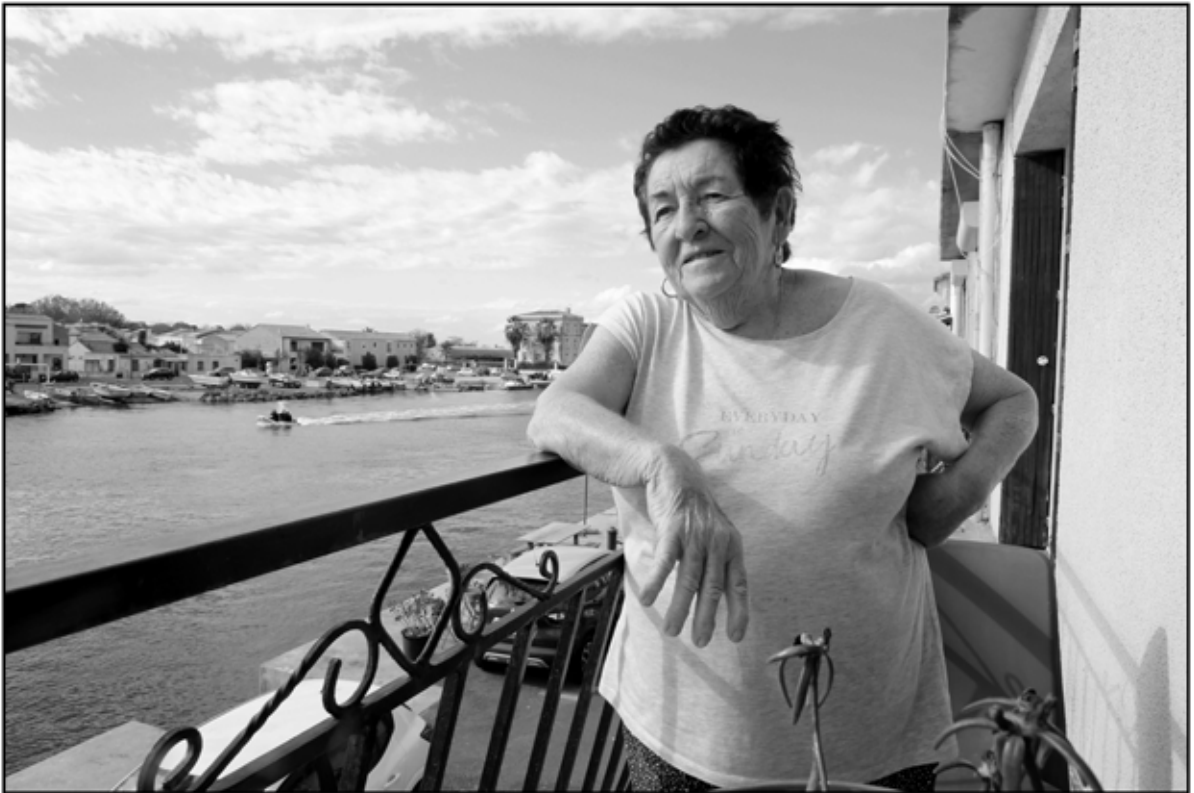
Sète 26