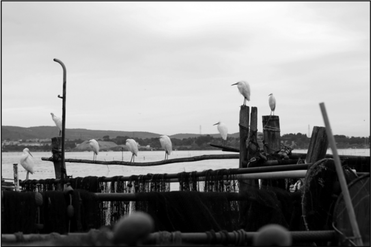
Sète 29