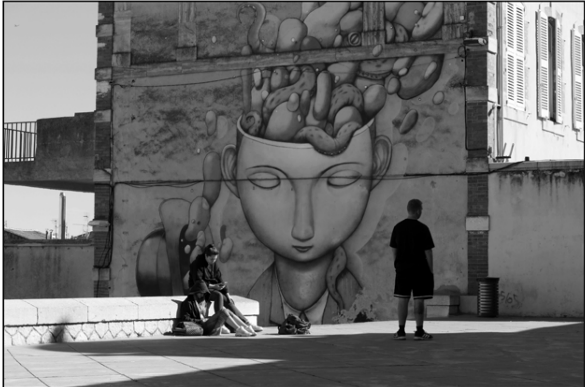
Sète 36