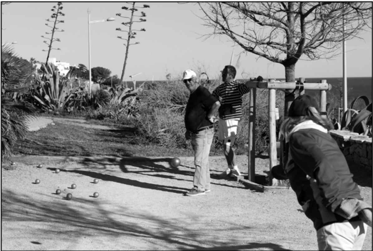
Sète 23