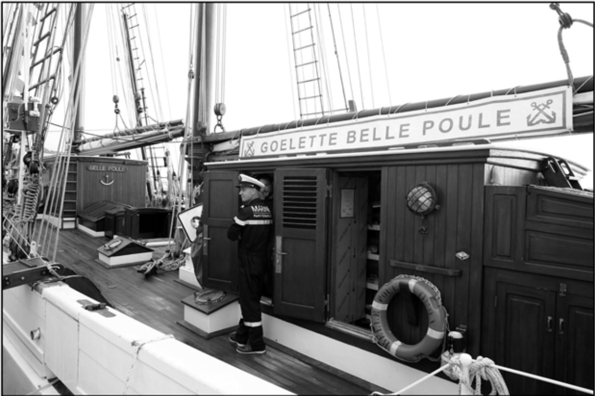
Sète 46