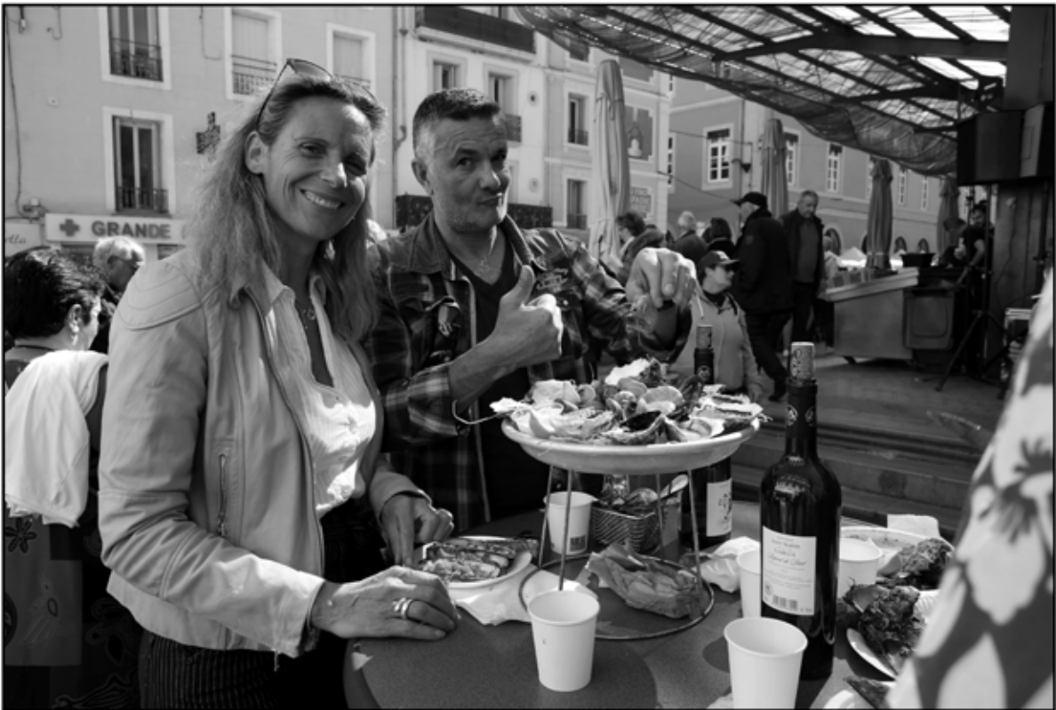
Sète 11