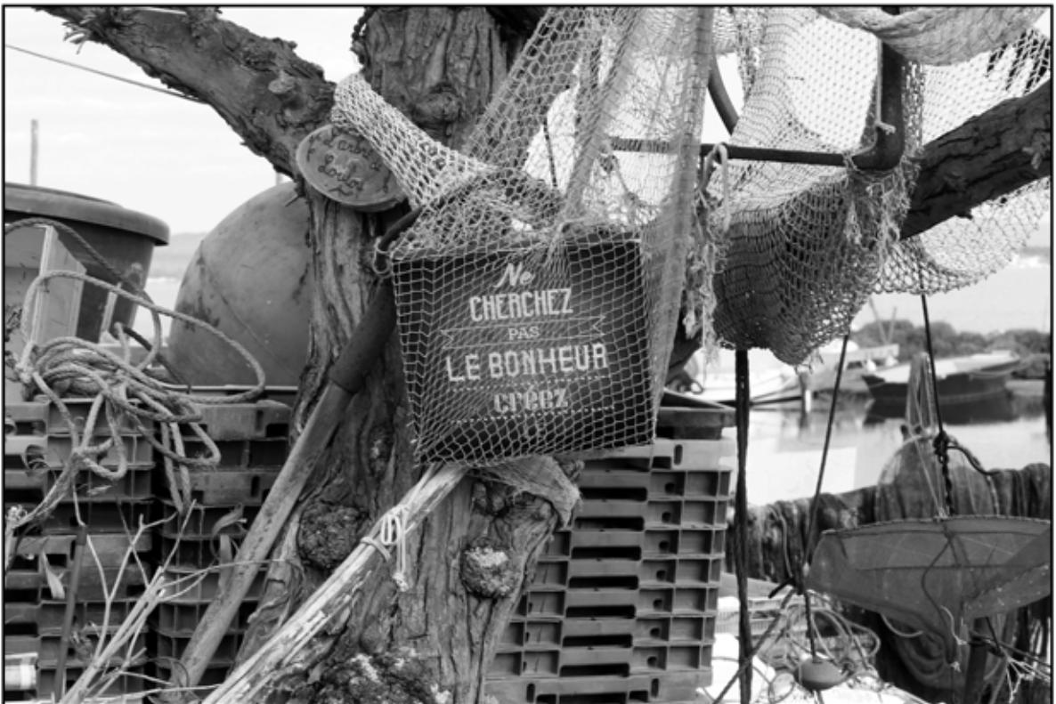
Sète 20