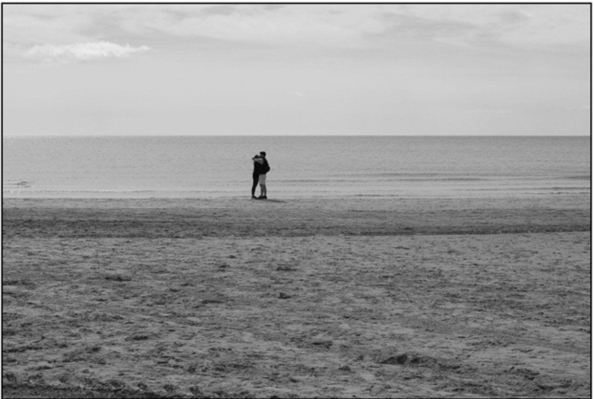
Sète 22