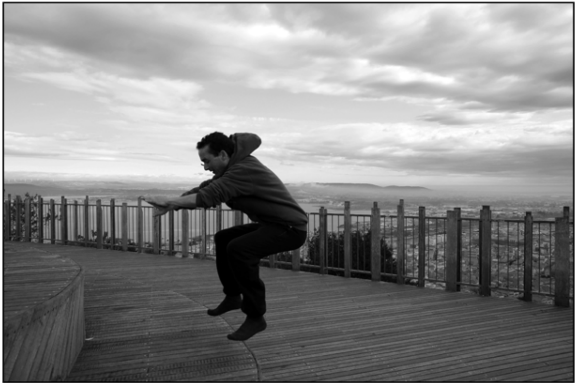
Sète 49