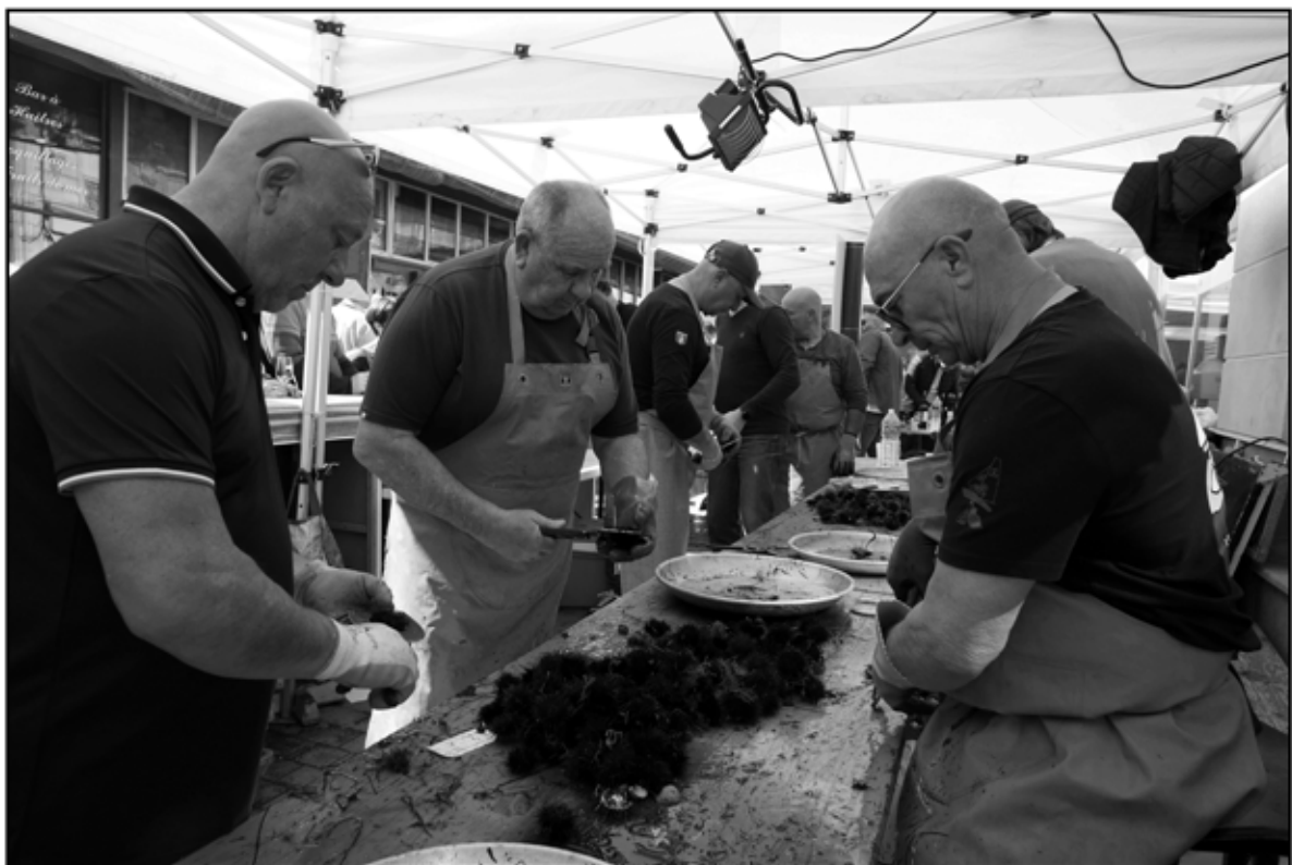
Sète 10