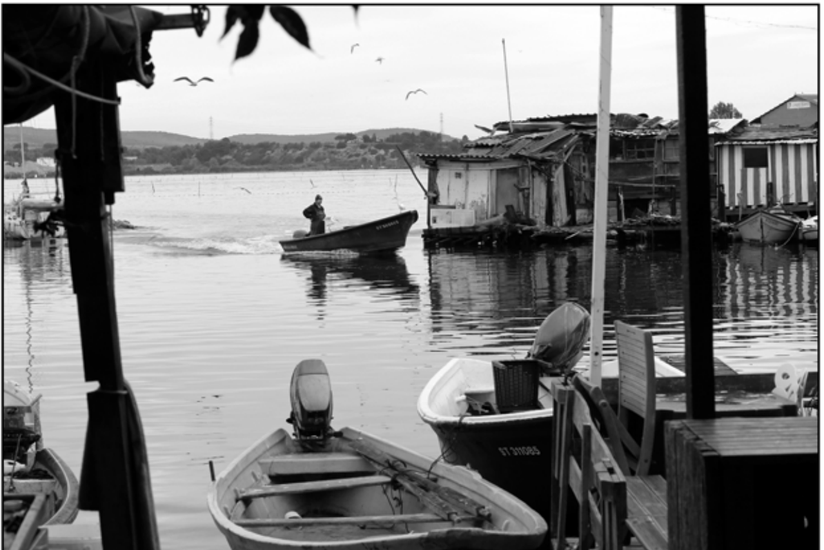
Sète 28