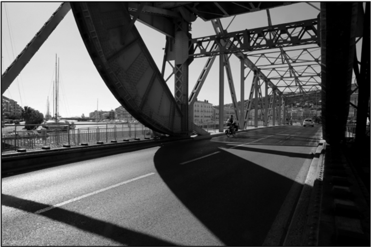
Sète 17