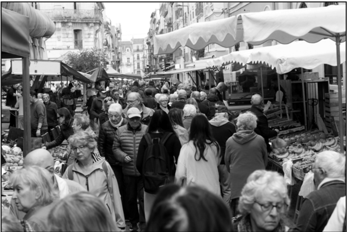
Sète 14