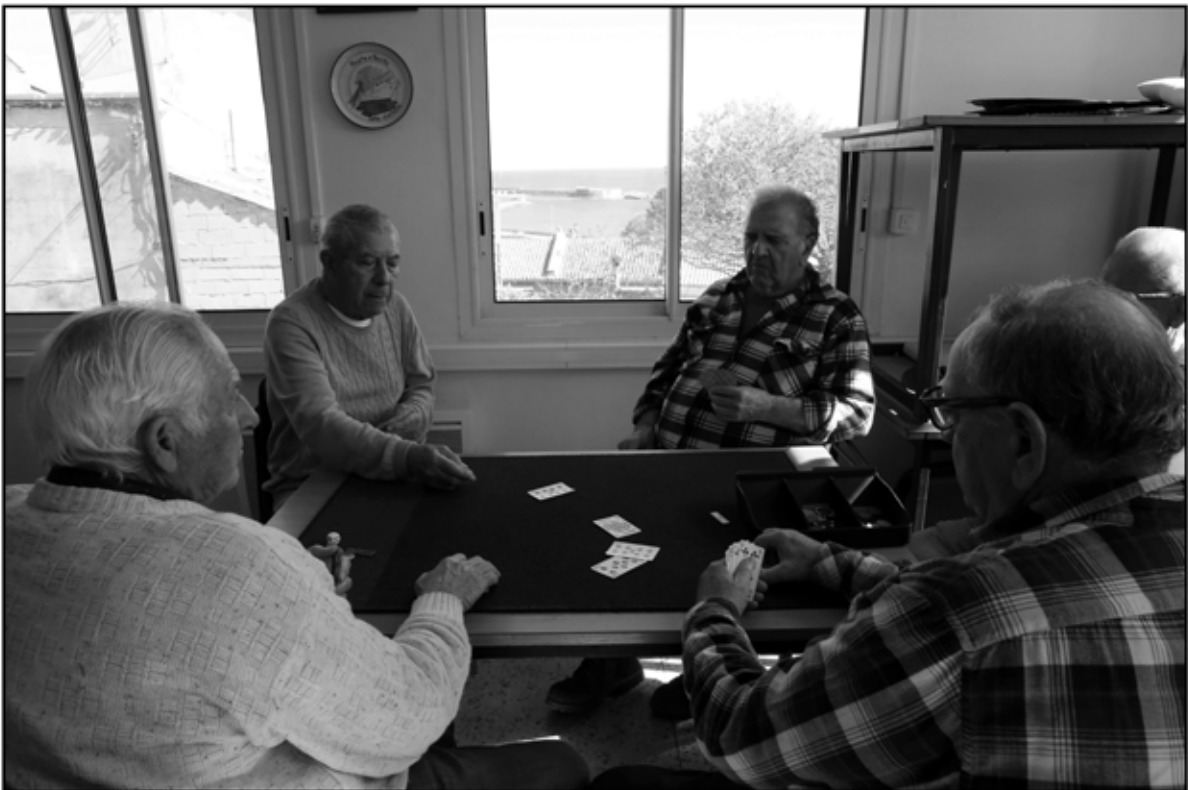
Sète 30