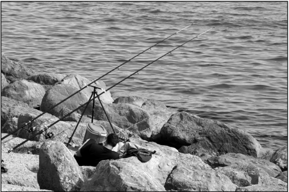
Sète 21