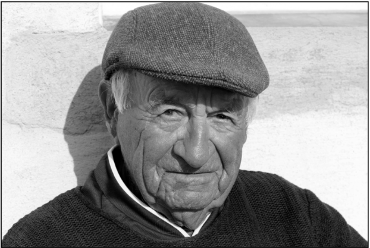
Sète 25 © Serge Assier