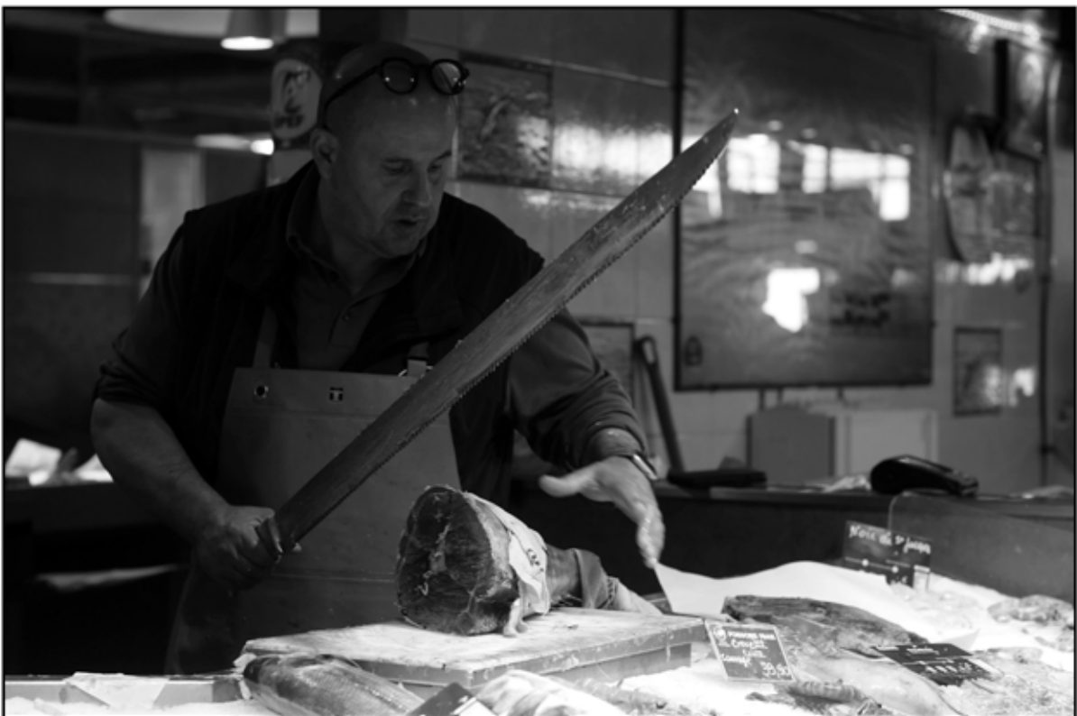
Sète 8