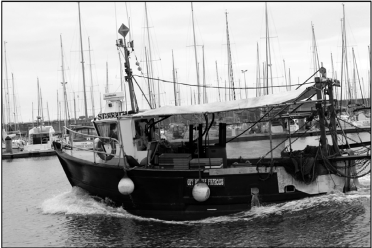
Sète 2