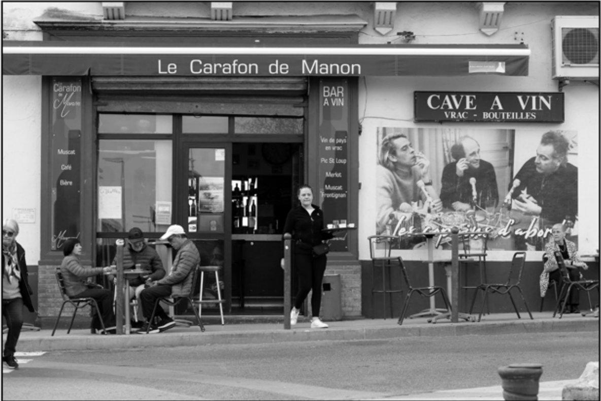
Sète 32