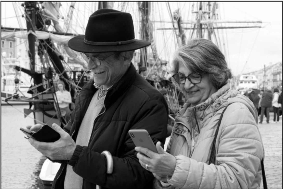
Sète 43