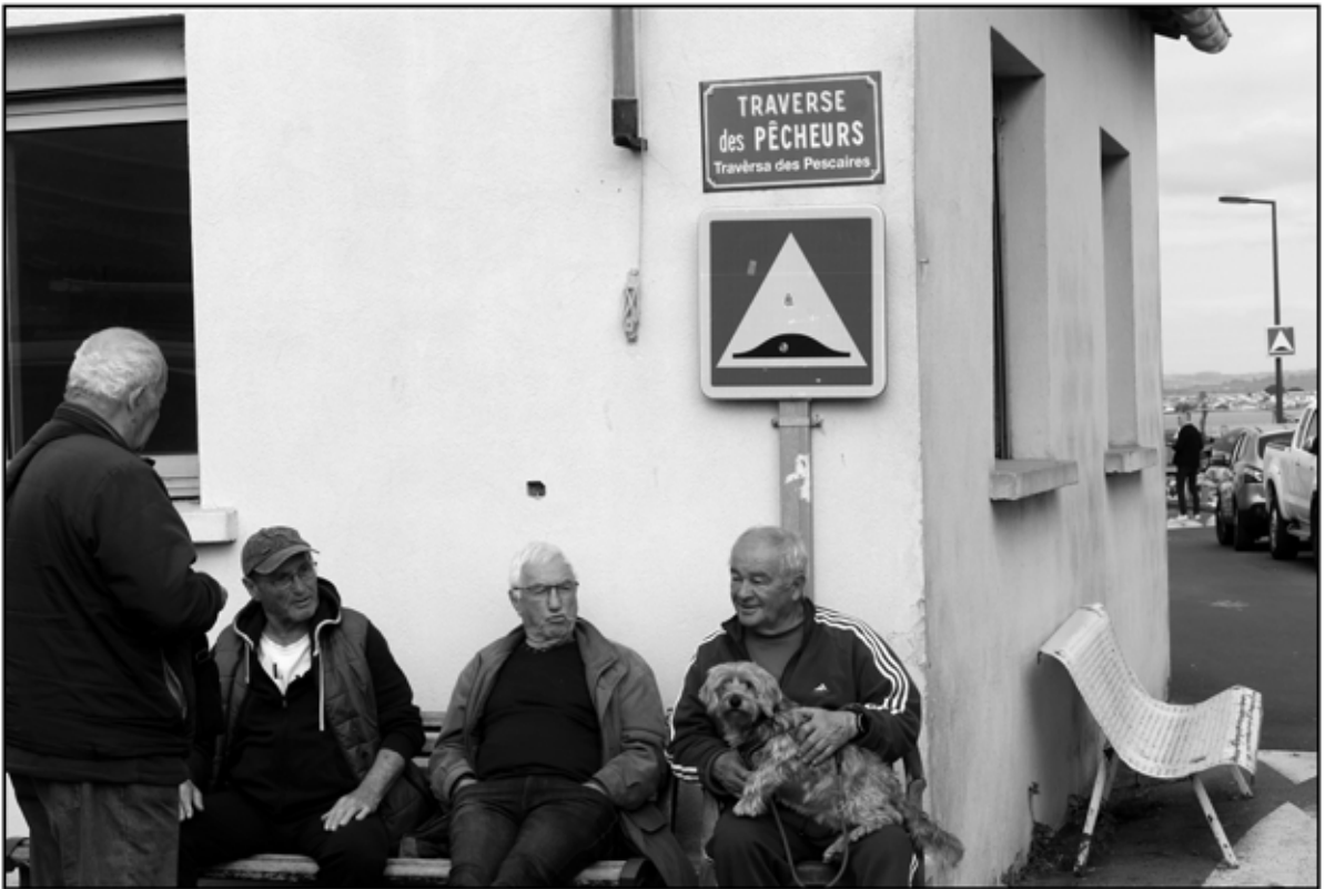
Sète 27