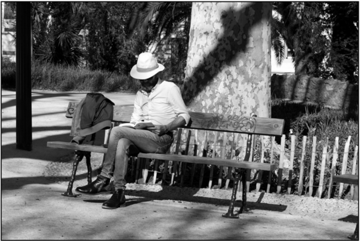
Sète 37