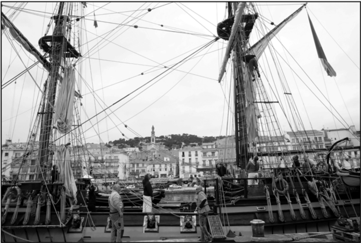
Sète 45