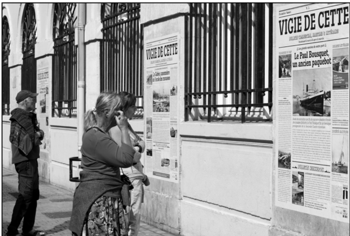
Sète 40