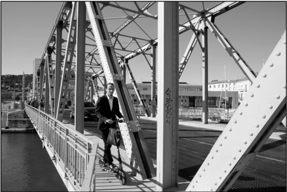
Sète 47 © Serge Assier