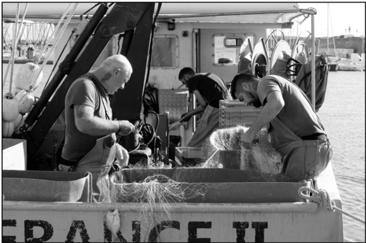
Sète 9