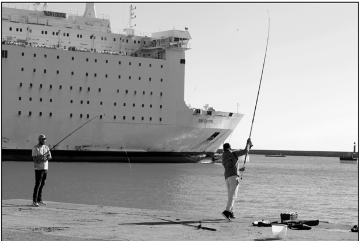
Sète 4