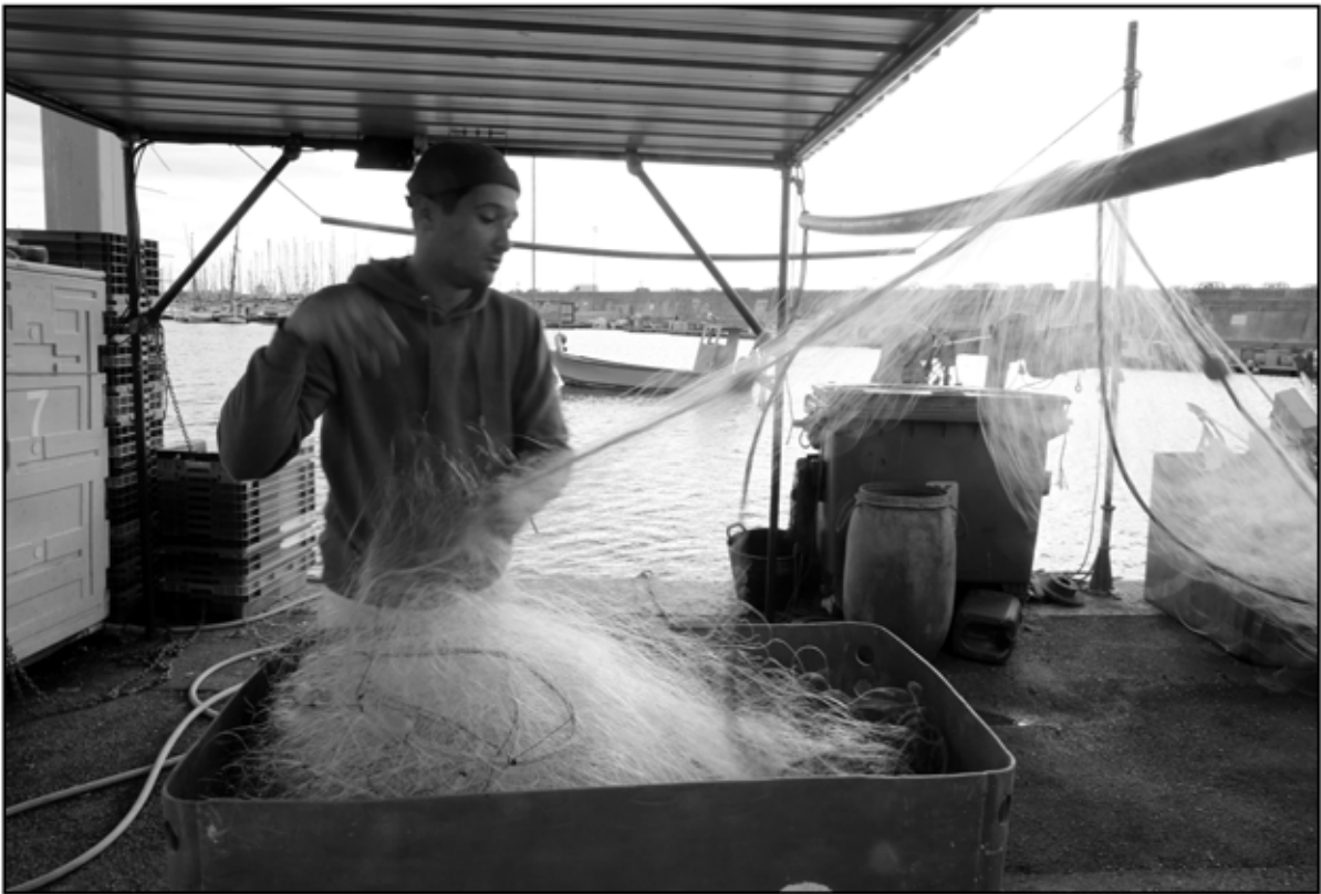
Sète 7