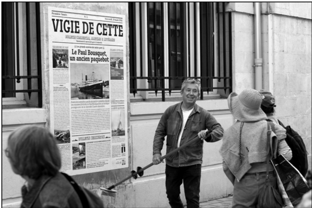
Sète 39