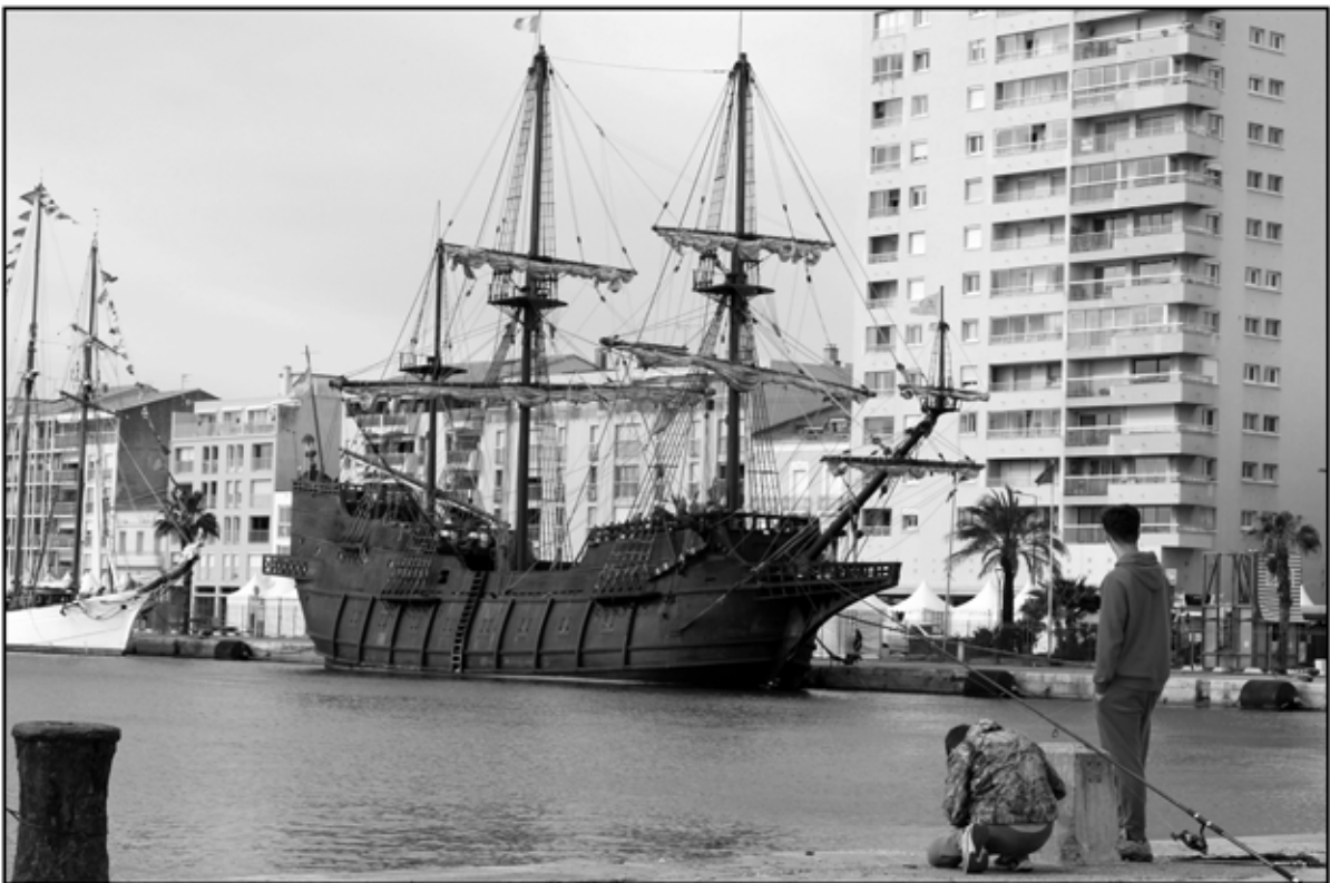
Sète 44