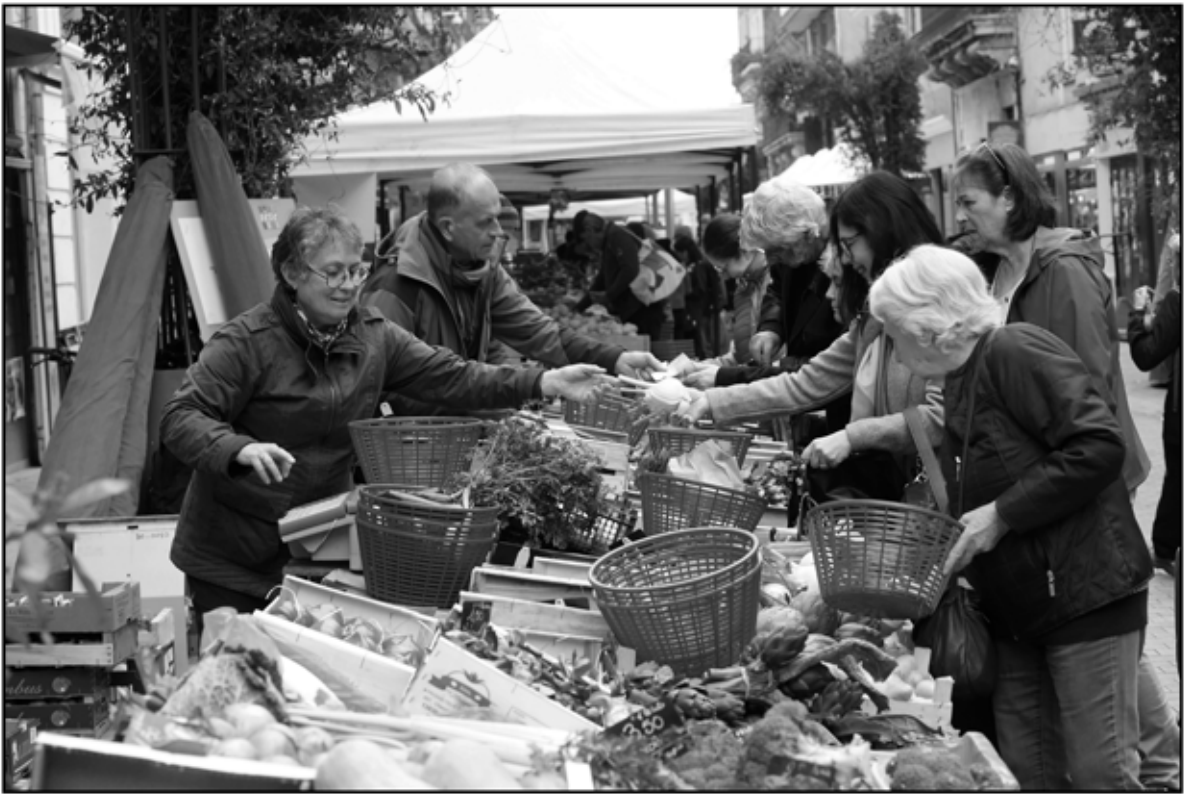
Sète 13